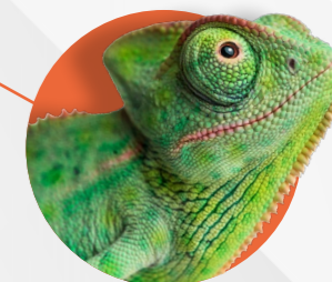
ELETTRONICA COMPATIBILE CON LE PRINCIPALI SOLUZIONI NEWIS