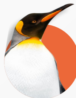
TECNOLOGIA DI REFRIGERAZIONE R290