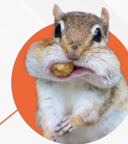
CAPACITÀ PRODOTTI MASSIMIZZATA