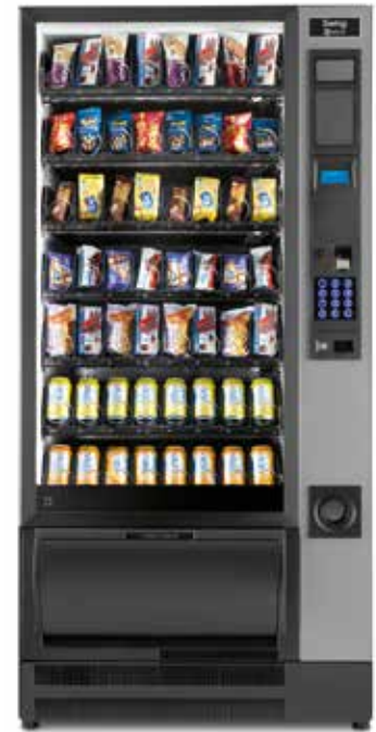
Immagine puramente indicativa.