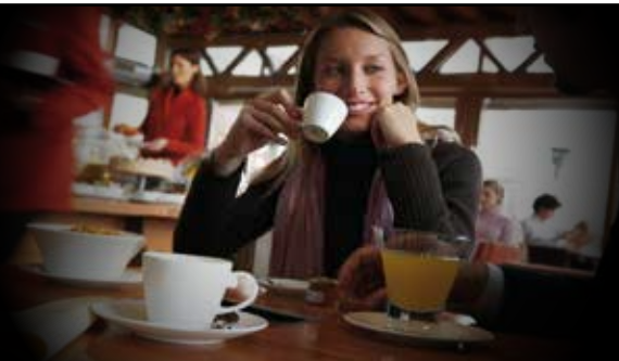
Espresso Plus Frischbrüh Version